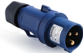
Ref. / Item 13200Y