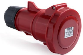
Ref. / Item 24303