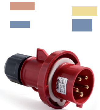
Ref. / Item 14303