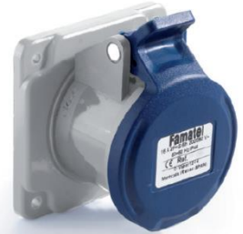
Ref. / Item 23270